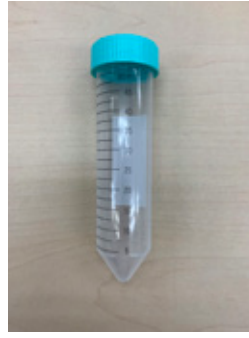
③採取キット(唾液用)